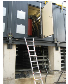
Onveilig gebruik van een